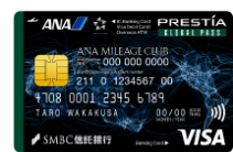
ANAマイレージクラブ GLOBAL PASS