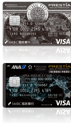
プレスティアゴールドプレミアムの証 プレスティアゴールドプレミアムGLOBAL PASS

各分野のエキスパートたちがチームとなり、 世界レベルのクオリティとホスピタリティで お客さまをサポートします。